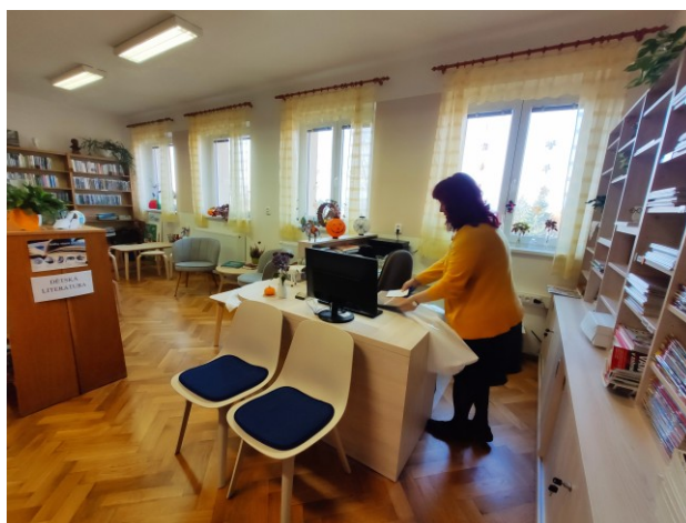
Knihovna Malé Svatoňovice