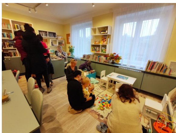
Knihovna Dolní Kalná

Na webu pověřené knihovny je pravidelně aktualizována sekce Informace pro knihovny ( https://www.mktrutnov.cz/pro-knihovny/informace-pro-knihovny ).